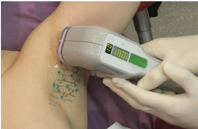
3 Schweißdrüsenthermolyse durch Mikrowellen.