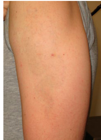
Profi-Schulter-Tätowierung: Ergebnis nach 7 Behandlungen